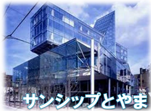
サンシップとやま