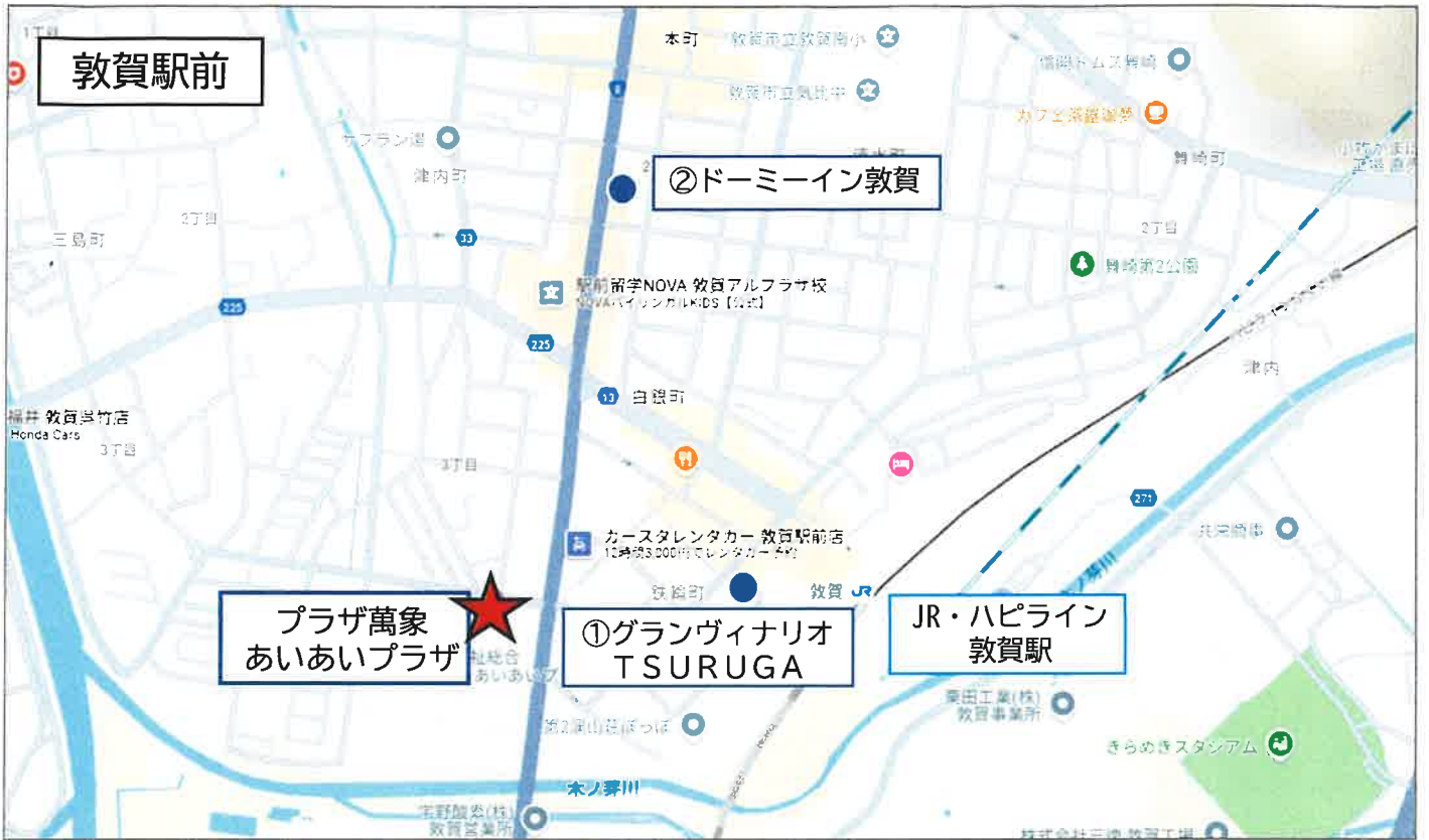
敦賀駅前地図は上記