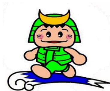
敦賀市公認キャラクター ツヌガ君

実行委員一同、一丸となって準備を進めております。多くの皆さまのご参加を心からお待ちしております。