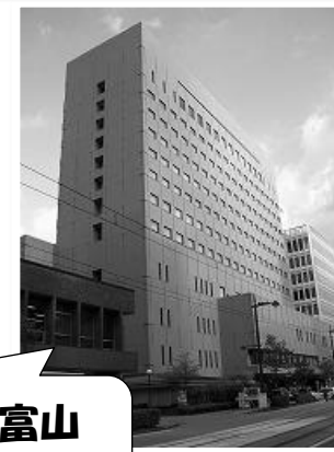
ホテルグランテラス富山 （富山市）