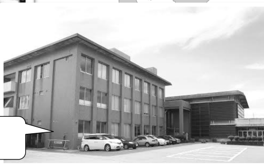
小杉社会福祉会館（射水市）